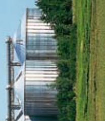
5. FACHTAGUNG BIOGAS 2010

Diese Veranstaltung wird gemeinsam vom Landesamt für Umwelt, Gesundheit und Verbraucherschutz (LUGV), dem Landesbauernverband Brandenburg e.V. (LBV) und der Brandenburgischen Energie Technologie Initiative (ETI) in Zusammenarbeit mit dem Fachverband Biogas (FvB) und dem Leibniz-Institut für Agrartechnik Potsdam-Bornim e.V. (ATB) im jährlichen Turnus ausgerichtet. Die BIOGAS 2010 ist die 5. Fachtagung in Folge.