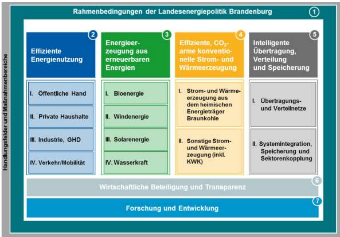
Abbildung 1: Die Handlungsfelder (1 – 7) und Maßnahmenbereiche der Energiestrategie 2030